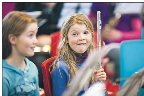
550 AMATØRMUSIKERE fra Norge gæster denne weekend Sæby. Musikere er i alderen 10 til 25 år.